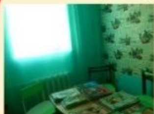
Библиотека-филиал №2 МБУК «ЛБС»

Присоединяйтесь! Центральная детская библиотека – г. Тулун, ул. Ленина, 91. т. 2-10-91